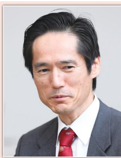
一般社団法人 全日本ピアノ指導者協会 専務理事