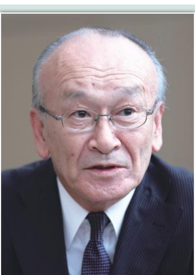
一般社団法人 全国外国語教育振興協会 事務局長

英会話スクールに通う方というのは、以前は社会人や留学希望者など、比較的年齢の高い方が多かったのですが、今は、英語4技能の中でも「話す」という部分に注力され、中学生より