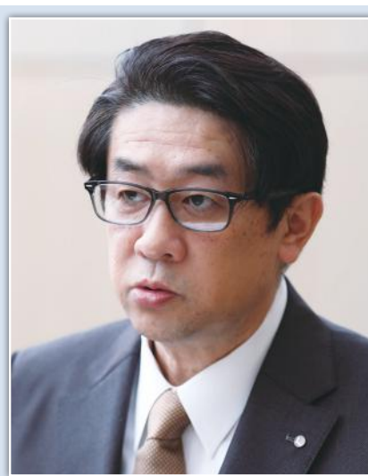
ONE VOICEでいつでも力を合わせられる状態に!

子供たちのために業界の垣根を乗り越え、さらには公教育と民間教育との垣根すら乗り越える